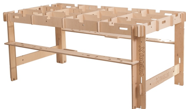
Rozmiar roboczy: L - 194x102 cm Wysokość: 85 cm