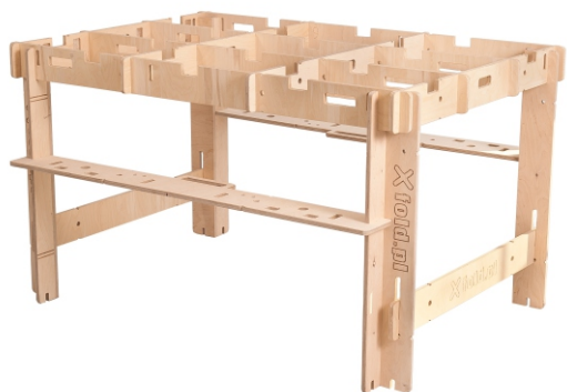
Rozmiar roboczy: M - 147x102 cm Wysokość: 85 cm