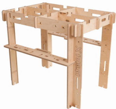
Rozmiar roboczy: S - 100x70 cm Wysokość: 85 cm